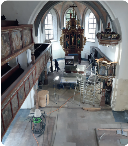
Ungewöhnliche Aktivitäten und Anblicke während der heißen Renovierungsphase