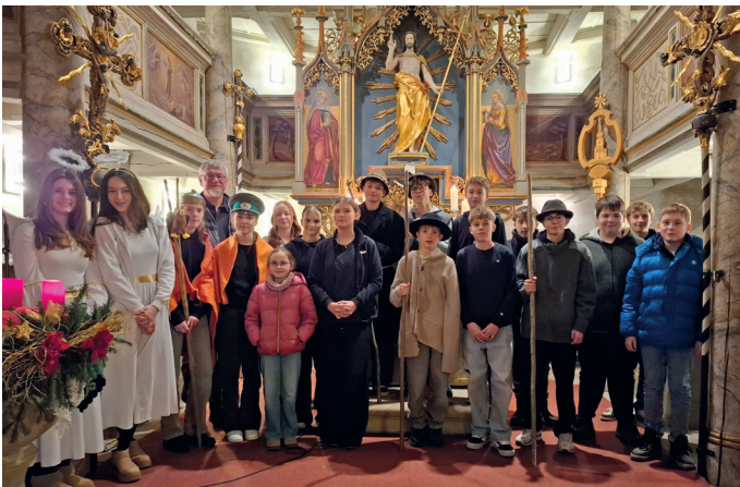
Konfirmanden Untersteinach/Guttenberg Krippenspiel 24.12.2025

Außerdem kann man sich heute schon das erste Treffen mit Kindern und Eltern am 2. Mai um 18:00 Uhr in den Kalender schreiben: Wir feiern gemeinsam Gottesdienst und bleiben in gemütlicher Runde zum Kennenlernen und Essen noch ein Stündchen zusammen...