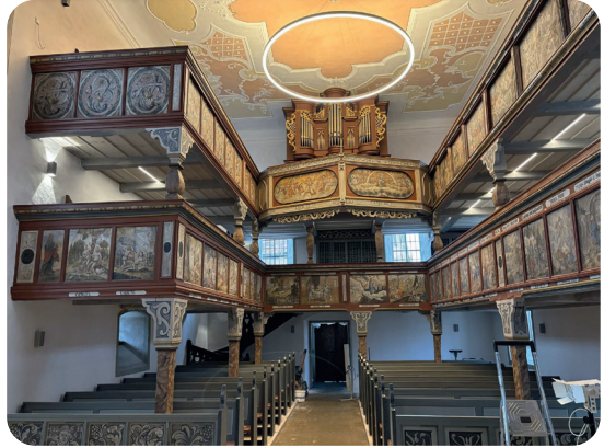
Das neue Beleuchtungskonzept lässt alles erstrahlen und ganz neue Perspektiven gewinnen – Glanz für Gottes Wohnung in Rugendorf!