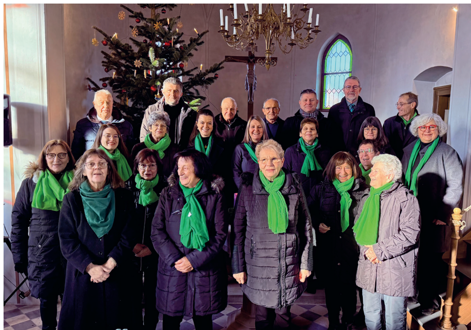
Ein Teil des Kirchenchore Grafengehaig in der Evang. Kirche Stadtsteinach